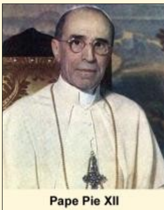
Pape Pie XII

spécial accordé par la Sacrée Congrégation des Religieux précise son mode de vie et sa situation en ce monastère d'accueil.