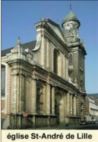
église St-André de Lille