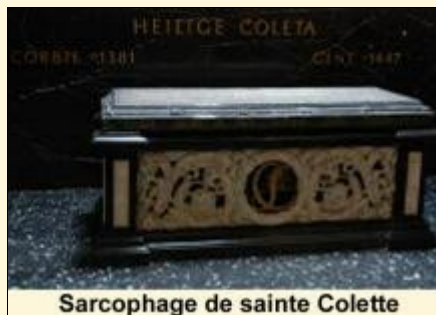
Sarcophage de sainte Colette

Le 6 décembre 1446, Colette arrive au monastère de Bethléem, à Gand, en Belgique. Trois mois plus tard, à l'âge de 66 ans, elle y meurt entourée de ses sœurs et de ses frères colettins. Elle fut enterrée dans le cimetière du monastère, sans suaire ni cercueil. En 1807, Colette est canonisée par le pape Pie VII.